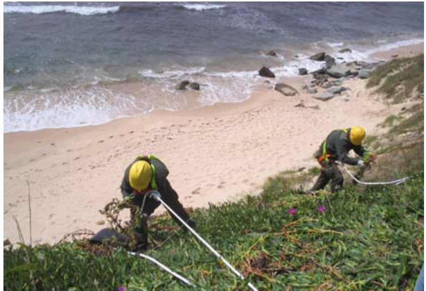
Tareas de eliminación de la ña de gato en las costas de Cádiz.

Una vez introducida una especie exótica, es importante detectarla con rapidez y tratar de erradicarla, lo cual solo resulta viable si las poblaciones poseen un tamaño reducido. Para lograr ese objetivo son fundamentales los planes